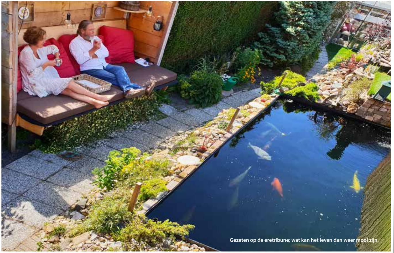
Gezeten op de ertribune; wat kan het leven dan weer mooi zijn.