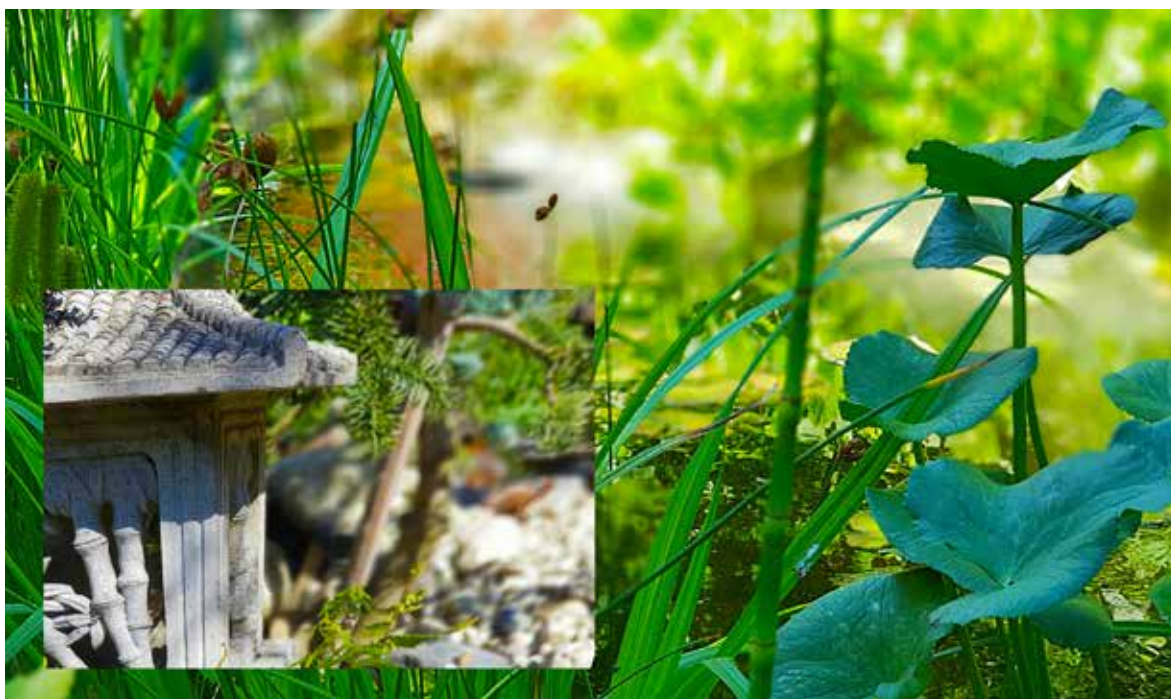
De natuurlijke vijver in de achtertuin.