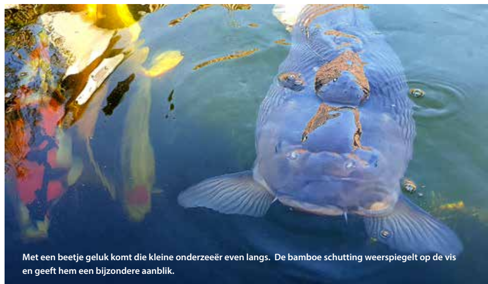
Met een beetje geluk komt die kleine onderzeeër even langs. De bamboe schutting weerspiegelt op de vis en geeft hem een bijzondere aanblik.

Toen wij in een ver verleden ooit de cursus waterkwaliteit deden werd dit ook gezegd, maar werd altijd erbij verteld dat dit een vuistregel is; geeft kortom een richting aan.