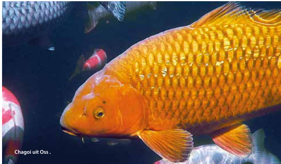
Chagoi uit Oss.

Als je dan ook nog bedenkt dat David Bowie ook niet meer onder ons is... Dat maakt dat een gewo-