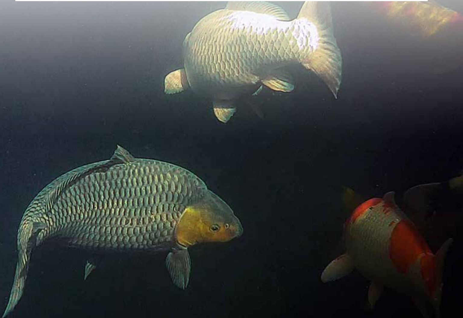
Onder water adembenemend.....