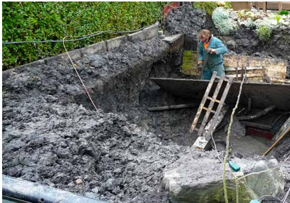
Het gat werd steeds een beetje dieper.

Gedurende dat jaar heeft Arie zijn hele systeem bij elkaar gedacht. Op zich best knap als je bedenkt dat je zonder enige kennis vooraf een gat begint te graven en een jaar later eindigt met een serieuze koi vijver met een systeem waarover is nagedacht.